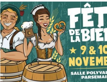
Fête de la bière