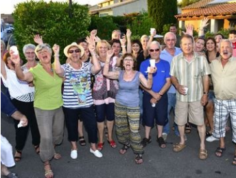
Fête des voisins