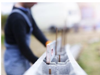
Permis de construire