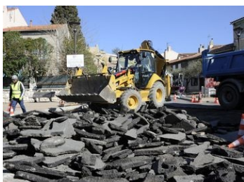
Permis de démolir