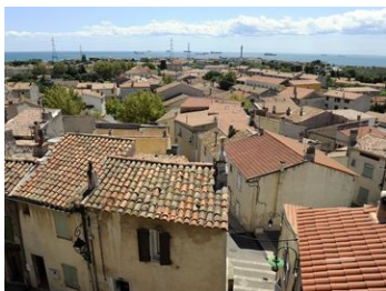
Demande de certificat d'urbanisme