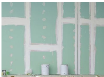
Aide à la rénovation