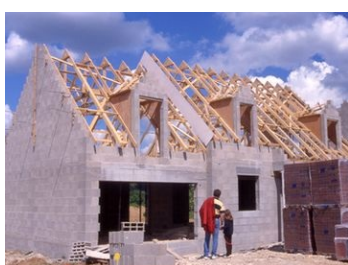
Aide à l'accession