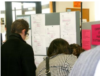
Offres d'emploi et stages