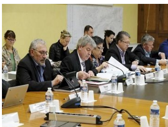
Séances du Conseil Municipal