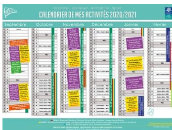
Calendrier de mes activités